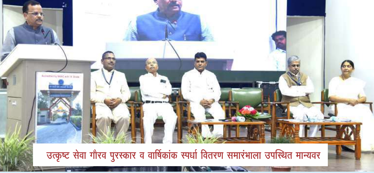
उत्कृष्ट सेवा गौरव पुरस्कार व वार्षिकांक स्पर्धा वितरण समारंभाला उपस्थित मान्यवर