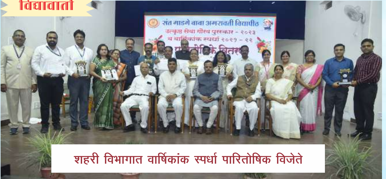
शहरी विभागात वार्षिकांक स्पर्धा पारितोषिक विजेते