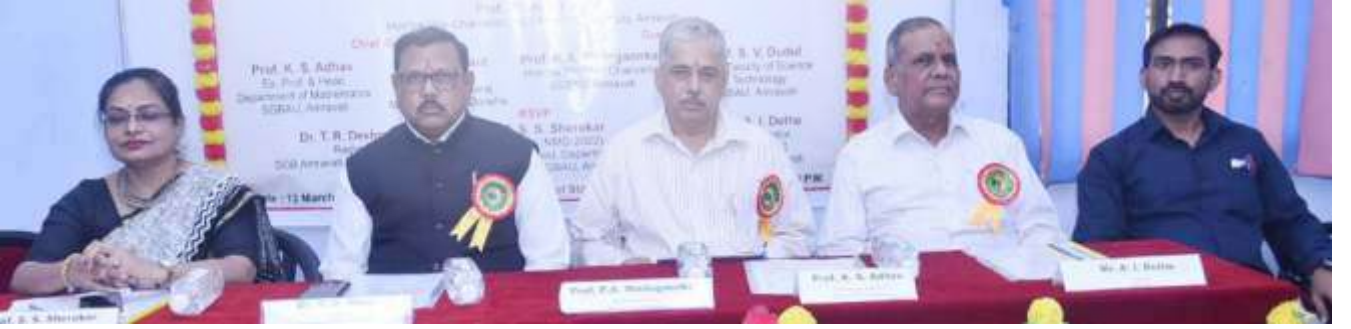
कार्यक्रमाला उपस्थित मान्यवर