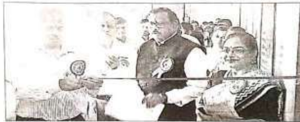
Guests inaugurating the competition.