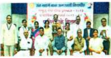
सत्कार स्वीकारल्यानंतर अधिकारी-कर्मचारी कुलगुरूंसह एकत्र आले, ते सत्कार.