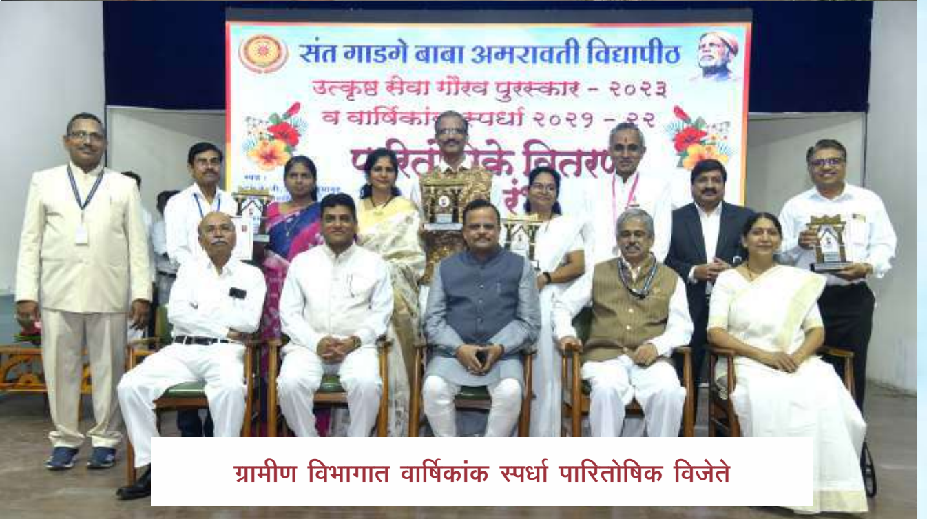
ग्रामीण विभागात वार्षिकांक स्पर्धा पारितोषिक विजेते